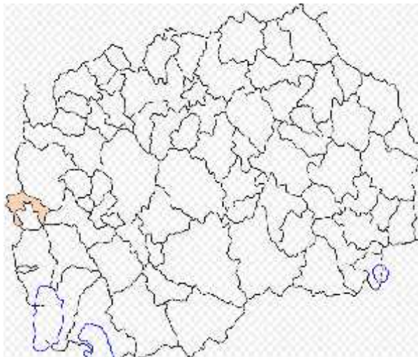
Fotografia 1: Komuna Dibër

Komuna Dibër gjindet në pjesën perëndimore të Republikës së Maqedonisë së Veriut dhe i takon Rajonit planor Jug- perëndimor. Komuna gjindet në Fushën e Dibrës ndërmjet vargmaleve Deshat, Liqenit të Dibrës dhe ultësirës së Lumit Drini i Zi, e cila njëkohësisht e mbush liqenin sëbashku me Lumin Radika. Teritori i Komunës Dibër në veri- lindje kufizohet me komunën Mavrovë dhe Rostushë, në jug me Qendrën Zhupë dhe në një pjesë të vogël me Strugën, në jug- lindje me Kërçovën dhe Debërcën dhe në perëndim me Republikën e Shqipërisë.