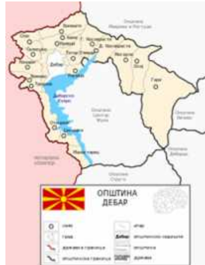
Fotografia 2: Vendbanimet e Komunës

Komuna Dibër është komunë e vjetër dhe si e tillë ka funksionuar në periudha të ndryshme. Nga viti 2004 në pajtueshmëri me Ligjin për organizim territorial dhe vetëqeverisje lokale (Gazeta zyrtare e RM- së nr. 22/2004) komuna Dibër është formuar në kufijtë në të cilat egzisto edhe tani. Komuna numëron gjithsej 18 vendbanime, nga të cilat sipas Rregjistrimit të popullsisë të vitit 2002, 3 fshatra janë tërësisht të zbrazura (Bomova, Konjara, Taraniku). Kryeqendra e komunës është qyteti i Dibrës.